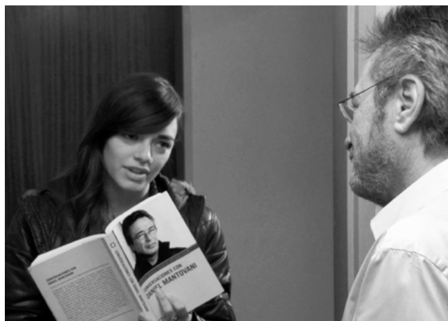
«Citoyen d'honneur» de Mariano Cohn et Gastón Duprat